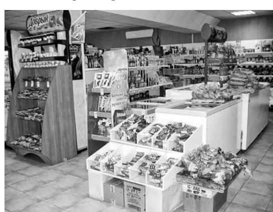
Часть торгового зала.

«В этом месяце, например, ожидаем, что товарооборот дойдет до миллиона. Да, для летнего времени это не чудо. Мы получаем свежий товар почти каждый день: дважды в неделю я езжу на базу, а в остальное время приезжают наши поставщики, то есть постоянно свежие продукты, если что залежалось – забирают, обменивают. Мы сотрудничаем с «Инмарко», «Останкино», «Дубки», «Океан», «Северное сияние», «Данпродукт», другими, давно и хорошо зарекомендовавшими себя фирмами, так что продукты получаем качественные.