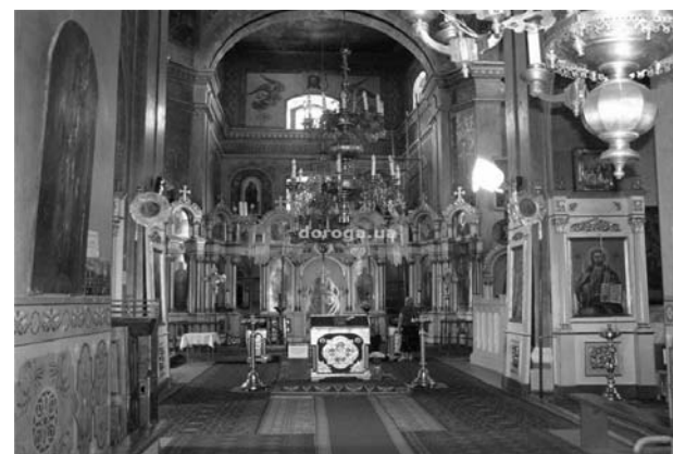
Церковь, в которой меня крестили.